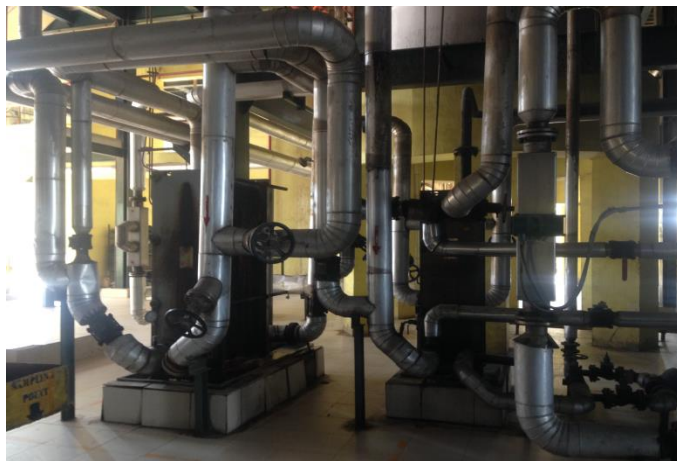
Gambar 3. Heat exchanger

130°C. Selanjutnya CPO dipanaskan lagi dengan PHE sehingga suhu CPO mencapai 100°C-110 °C. Setelah itu, CPO dapat masuk ke proses degumming .