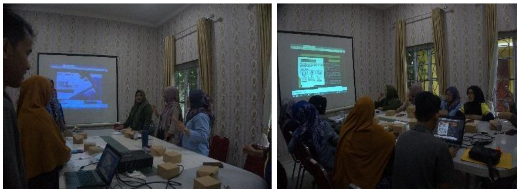
Gambar 3. Pelatihan Pemasaran Digital

Tahap ketiga adalah pelatihan yang bertujuan mentransfer pengetahuan sekaligus membentuk pola pikir baru. Materi pelatihan tidak hanya berfokus pada peningkatan keterampilan teknis, tetapi juga mencakup penguatan aspek kewirausahaan. Misalnya, peserta diajarkan bagaimana menyusun pencatatan keuangan sederhana, sehingga mereka mulai menyadari pentingnya memisahkan antara keuangan pribadi dan keuangan usaha (Pratama et al., 2020). Selain itu, diberikan pula pelatihan mengenai strategi pemasaran digital, seperti cara memanfaatkan media sosial, membuat konten sederhana, hingga mengelola interaksi dengan konsumen secara daring. Antusiasme peserta sangat tinggi, terutama ketika menyadari bahwa media digital dapat membuka peluang pasar yang lebih luas, bahkan hingga di luar wilayah desa. Pelatihan ini menjadi titik balik yang menandai pergeseran pola pikir: dari sekadar menjual peyek secara tradisional di pasar desa, menuju usaha yang berorientasi pada pasar modern dengan jangkauan yang lebih luas.