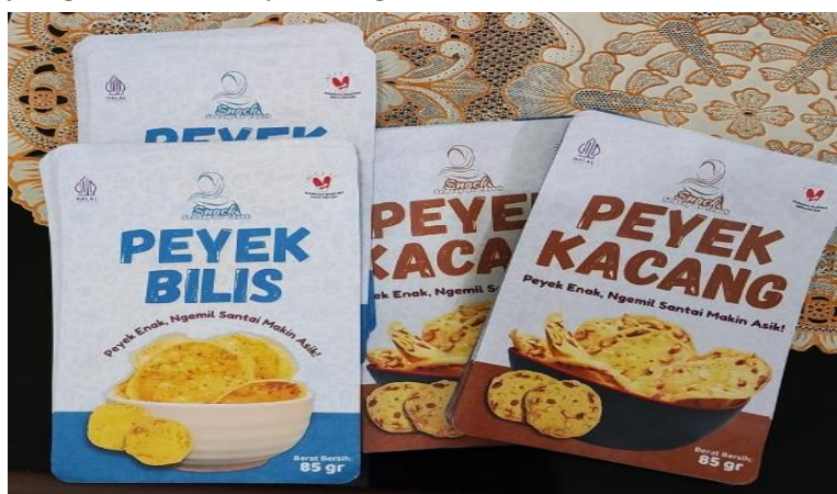
Gambar 8. Kemasan Baru

Dari sisi pemasaran, pelatihan branding dan digital marketing membawa perubahan yang sangat signifikan. Mitra yang sebelumnya hanya mengandalkan pemasaran dari mulut ke mulut kini mulai mengenal media digital sebagai sarana untuk memperluas jangkauan pasar. Melalui desain kemasan baru yang lebih menarik, pembuatan label produk, serta pemanfaatan aplikasi e-commerce dan media sosial, Peyek Sedap Bu Yayuk mampu memperkenalkan produknya ke konsumen di luar Desa Sebong Lagoi. Perubahan ini menandai pergeseran orientasi usaha dari sekadar produksi untuk konsumsi lokal menjadi usaha yang memiliki daya saing lebih luas.