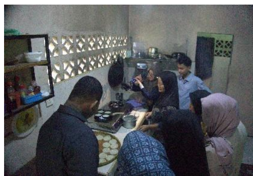
Gambar6. Praktik Penggunaan Alat