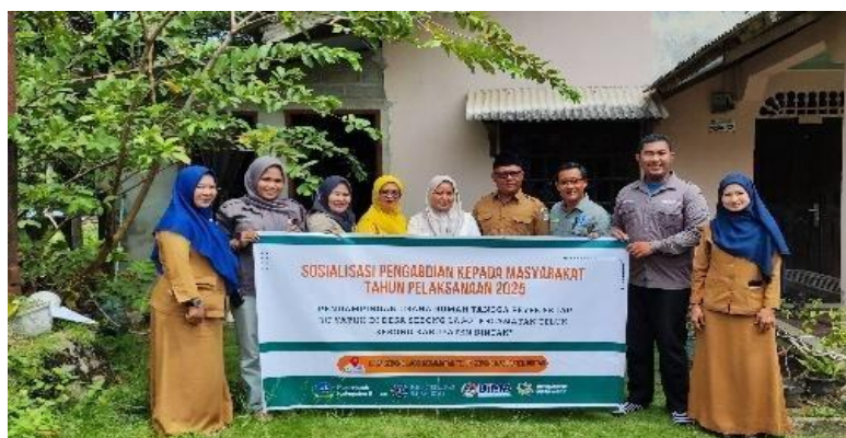
Gambar 2. Sosialisasi Awal Program

Pelaksanaan program pendampingan usaha Peyek Sedap Bu Yayuk di Desa Sebong Lagoi dapat dikatakan sebagai proses pemberdayaan masyarakat yang berjalan secara bertahap, sistematis, dan berkelanjutan (Ekasari, 2024). Pendampingan ini tidak hanya diarahkan untuk memperbaiki persoalan teknis dalam produksi dan pemasaran, tetapi juga berupaya menumbuhkan perubahan cara pandang, sikap, dan perilaku masyarakat dalam mengelola usaha rumah tangga secara profesional. Dengan pendekatan partisipatif, program ini berhasil menghadirkan dinamika yang kaya, mulai dari kegiatan observasi awal, sosialisasi, pelatihan, penerapan teknologi, hingga pendampingan intensif yang menumbuhkan kepemimpinan lokal dan kesadaran kolektif mengenai pentingnya transformasi sosial (Fadillah et al., 2024). Tahap pertama yang dilakukan adalah tim terlebih dahulu melakukan observasi awal melalui wawancara dan pengamatan langsung terhadap proses produksi, manajemen, dan pemasaran usaha untuk memahami kebutuhan dan permasalahan mitra secara faktual. Berdasarkan hasil observasi tersebut, tim kemudian melaksanakan tahap sosialisasi sebagai langkah awal interaksi formal yang berfungsi membangun komunikasi dan kepercayaan antara tim pengabdian dan mitra.