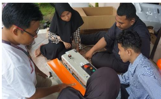
Gambar 5. Pelatihan Penggunaan Teknologi

Tahap keempat adalah penerapan teknologi yang membawa dampak signifikan terhadap kualitas produk dan perilaku kerja. Mitra diperkenalkan dengan mesin pengemas sederhana yang dapat mempercepat proses pengemasan sekaligus meningkatkan higienitas produk. Hasilnya, produk peyek tidak hanya lebih tahan lama, tetapi juga tampil lebih menarik dengan kemasan yang modern. Selain itu, penggunaan aplikasi desain label membantu mitra menciptakan identitas visual produk yang khas, yang berfungsi sebagai strategi branding untuk membedakan Pekat Sedap Bu Yayuk dari produk serupa di pasaran. Pada tahap ini, mitra juga mulai terbiasa menggunakan media digital sebagai sarana promosi. Perubahan ini menggambarkan transformasi perilaku kerja: dari cara-cara tradisional yang cenderung manual menuju pendekatan yang lebih modern, efisien, dan berbasis inovasi.